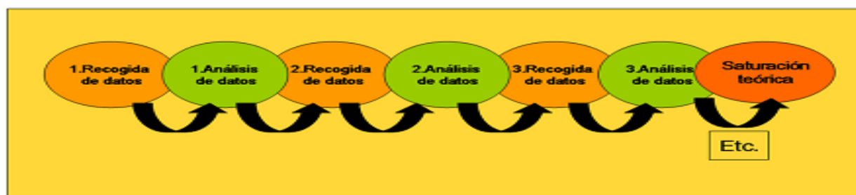
Imagen N 1. Muestreo Teórico

Entonces, mediante la educación popular quien aparece para desarrollar acciones intencionalmente orientadas a ampliar la forma de comprender y actuar de los sectores populares se refuerza y conlleva a una consolidación de la unidad básica integradora proyecto de la Universidad Bolivariana de Venezuela para generar conocimiento y apropiarse de los saberes pertinentes para la construcción de los sujetos populares. Es importante presentar el proceso o manejo de la data, a continuación: